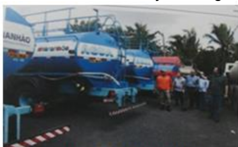
Fiscalização em carros pipas