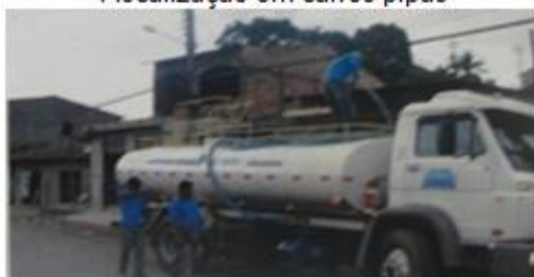
Fiscalização de abastecimento no Bairro de Coroadinho