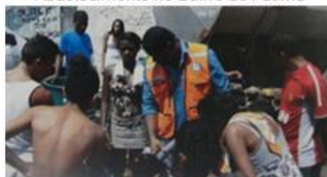
Fiscalização de abastecimento no Bairro de Fátima