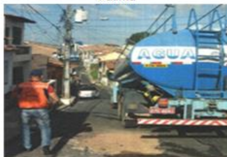
Fiscalização da CEPDECMA