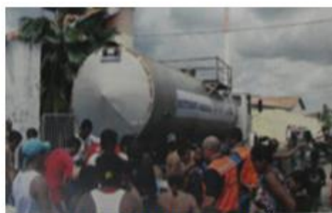
Abastecimento no Bairro de Fátima