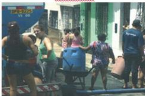
Abastecimento nos bairros de São Luís/MA